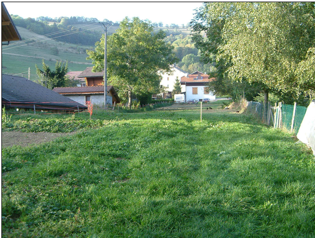
En plein centre du village et à proximité du départ des remontées mécaniques.

Ce projet se situe proche du centre de Bernex, au lieu-dit «Plan champ ouest». Cet ensemble immobilier se compose de 4 chalets indépendants type T3 de 62 m 2 habitables.